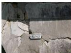
Emplacement du nivellement reporté