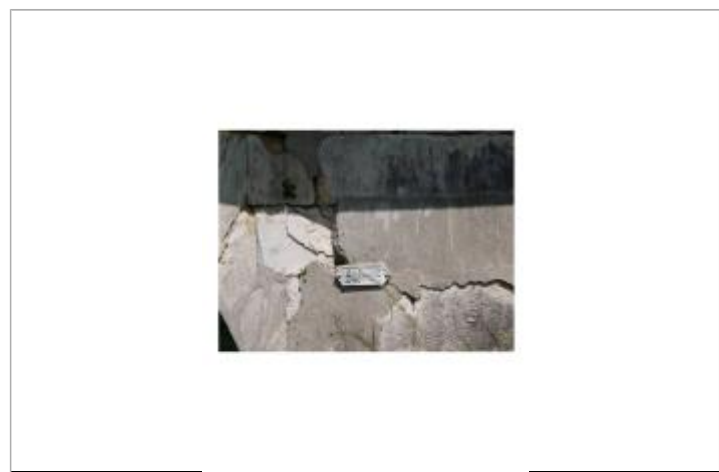
Emplacement du nivellement reporté

GÉNÉRAL Code : WEB_R_202105120416 Date de mise à jour : 23/06/2021 Auteur : DDT55