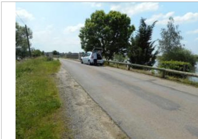
Emplacement du nivellement reporté