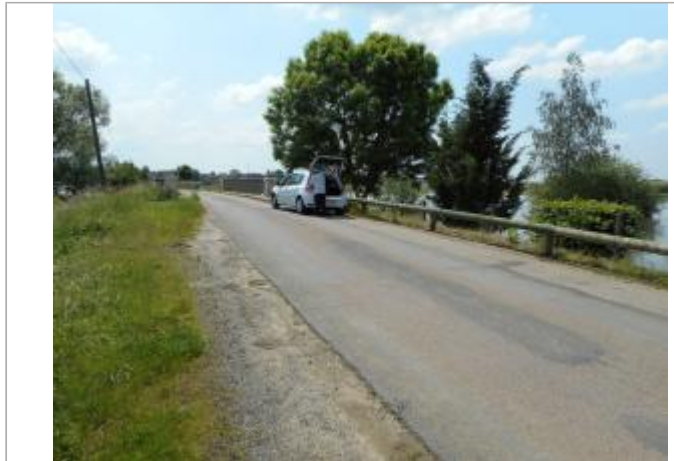
4ème poteau de glissière

Coordonnées WGS84 : X: 5.72910420 / Y: 49.16124500