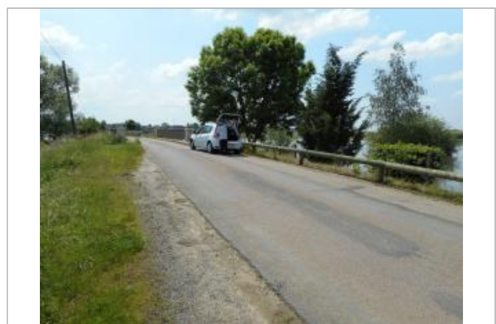
Emplacement du nivellement reporté

GÉNÉRAL Code : WEB_R_202105123853 Date de mise à jour : 11/03/2022 Auteur : DDT55