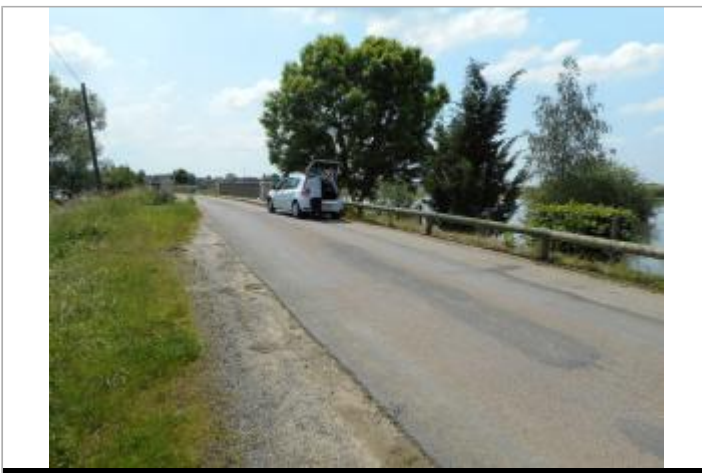
4ème poteau de glissière

GÉOLOCALISATION Coordonnées WGS84 : X: 5.72910420 / Y: 49.16124500 Coordonnées RGF93 (Lambert 93) : X: 899034 / Y: 6899159.96 Coordonnées RGF93 (ETRS89) : X: 5.7291042 / Y: 49.161245 Code Hydro: A8--0100 Rive de référence: Gauche