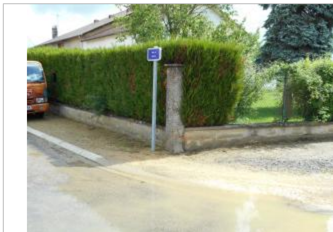
Emplacement du nivellement reporté