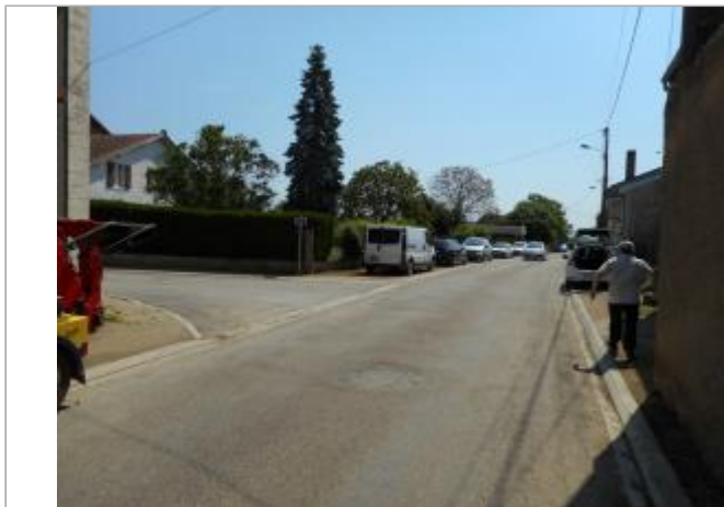
muret angle rue Joncroy et rue du Paquis

Coordonnées WGS84 : X: 5.71302530 / Y: 49.16800500