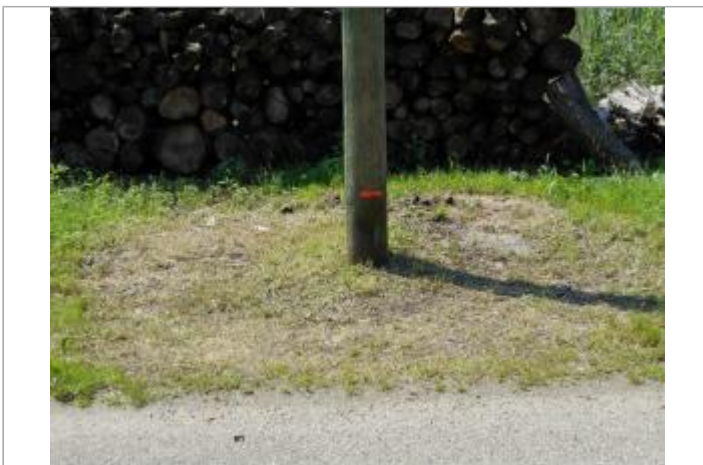
poteau telecom bois

GÉOLOCALISATION Coordonnées WGS84 : X: 5.70762950 / Y: 49.16897200 Coordonnées RGF93 (Lambert 93) X: 897439 / Y: 6899964.99 Coordonnées RGF93 (ETRS89) : X: 5.7076295 / Y: 49.168972 Code Hydro: A8--0100 Rive de référence: Gauche