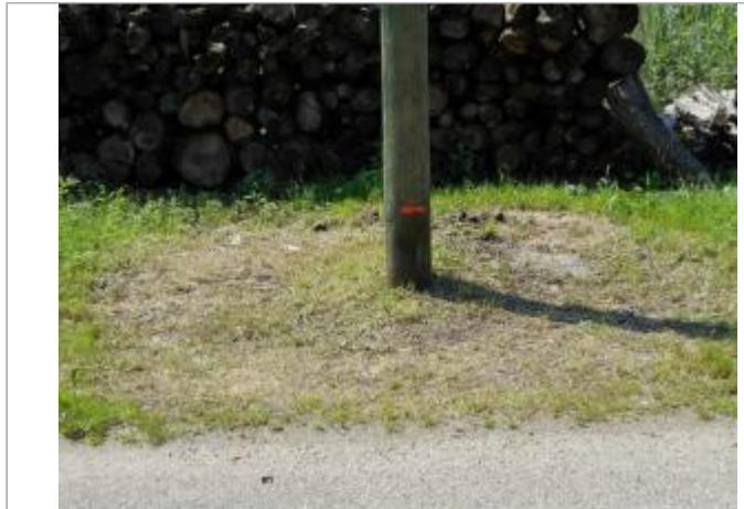
poteau telecom bois

Coordonnées WGS84 : X: 5.70762950 / Y: 49.16897200