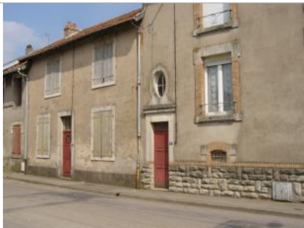
Emplacement du nivellement reporté vue éloigné