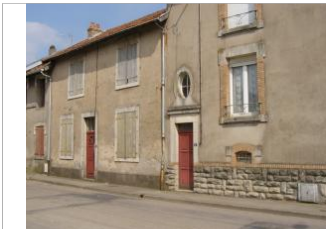
porte d'entrée du 6 rue de Foameix

Coordonnées WGS84 : X: 5.63193690 / Y: 49.21688700