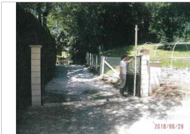
Vue du site de l'entrée privée d'Essay