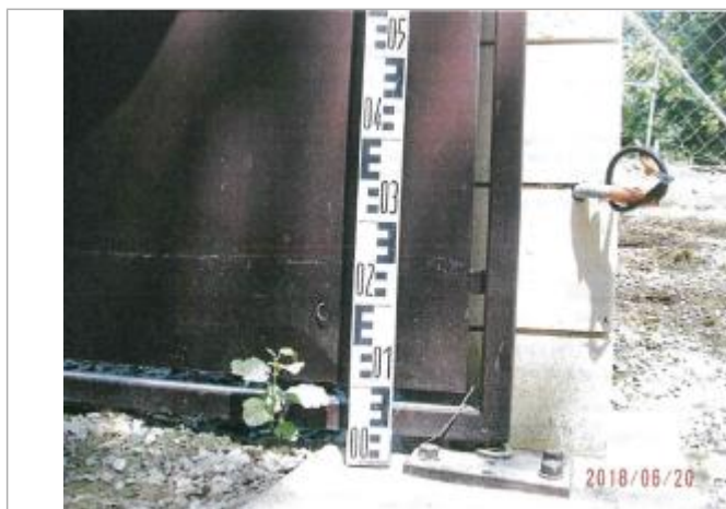
Repère du site de l'entrée privée d'Essay

Altitude calculée de l'eau (en m) : 152.28 m