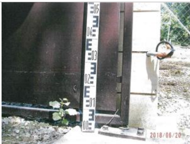
Repère du site de l'entrée privée d'Essay

Altitude calculée de l'eau (en m) : 152.28