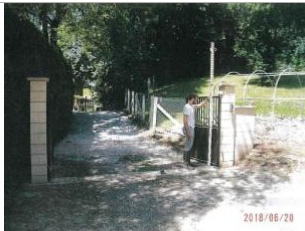
Vue du site de l'entrée privée d'Essay