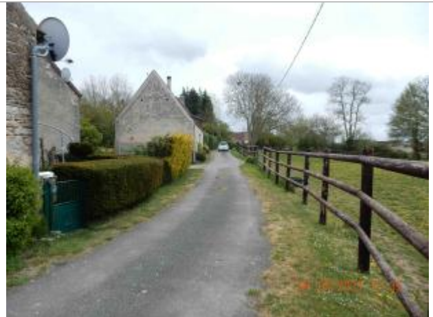
Hameau " Guichaumont Belfonds"