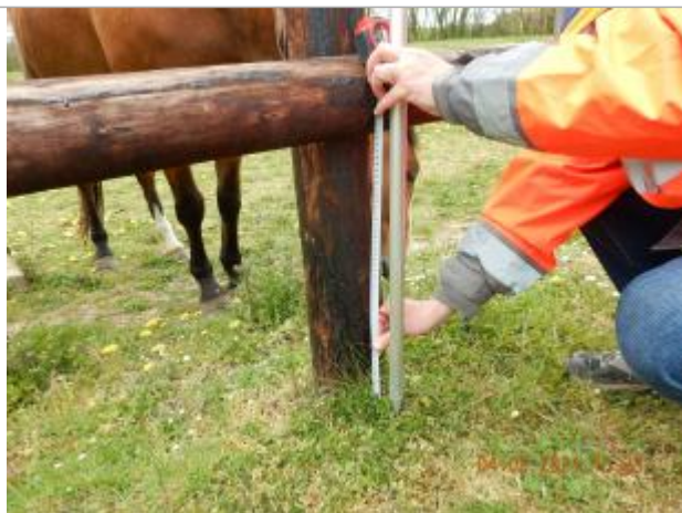
Laisse de crue à 40 cm du sol sur le piquet de la cloture

NIVELLEMENT SPC SACN. LE SPC N'EST PAS GÉOMÈTRE EXPERT, LES COTES SONT DONNÉES À TITRES INDICATIF. - 04/05/2021