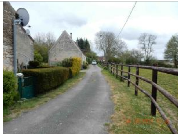
Hameau " Guichaumont Belfonds"