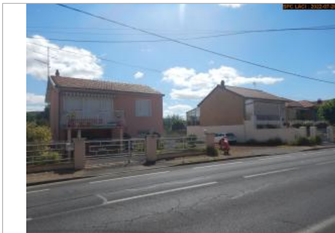
Vue du site éloignée