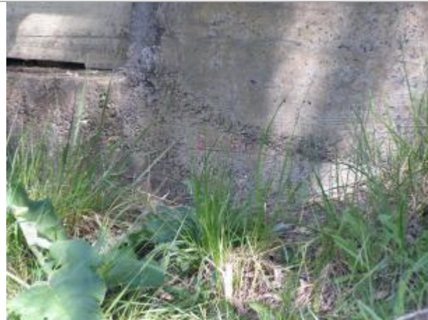
mur en retour culée aval rive gauche