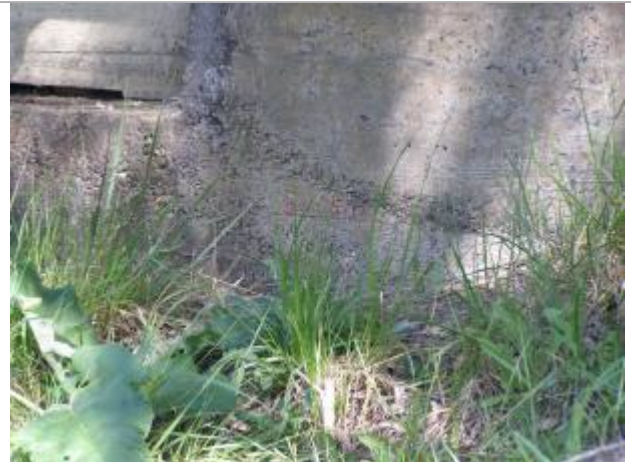
mur en retour culée aval rive gauche