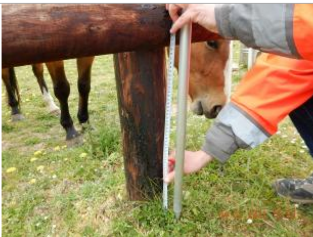
Laisse de crue à 40 cm du sol sur le piquet de la cloture

NIVELLEMENT SPC SACN. LE SPC N'EST PAS GÉOMÈTRE EXPERT, LES COTES SONT DONNÉES À TITRES INDICATIF. - 04/05/2021