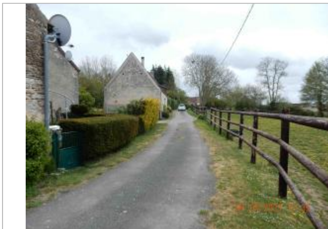
Hameau "de Guichaumont"