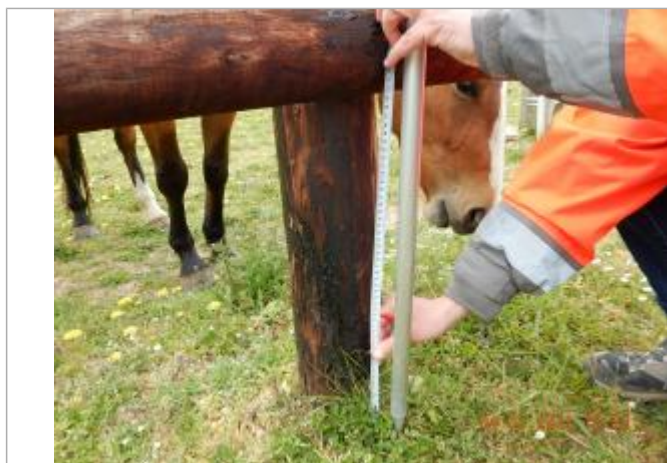
Laisse de crue à 40 cm du sol sur le piquet de la cloture

NIVELLEMENT SPC SACN. LE SPC N'EST PAS GÉOMÈTRE EXPERT, LES COTES SONT DONNÉES À TITRES INDICATIF. - 04/05/2021