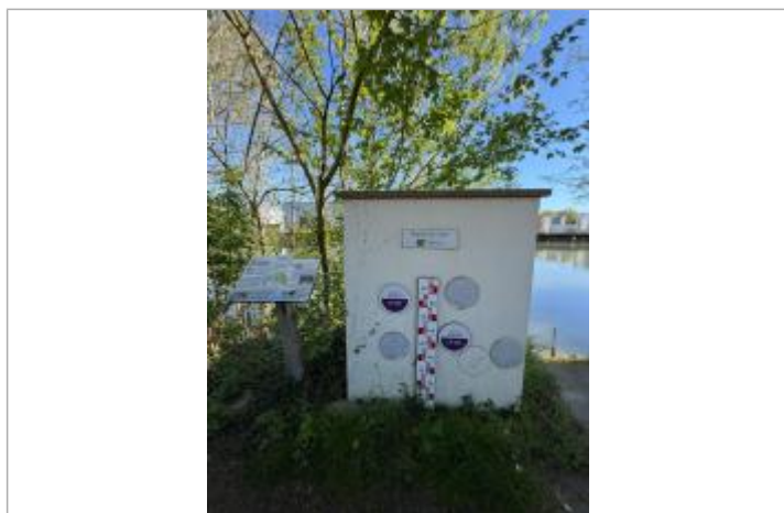
Vue des repères