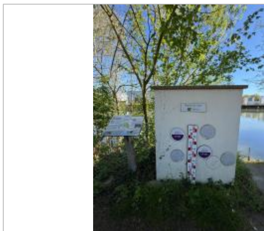
Vue des repères