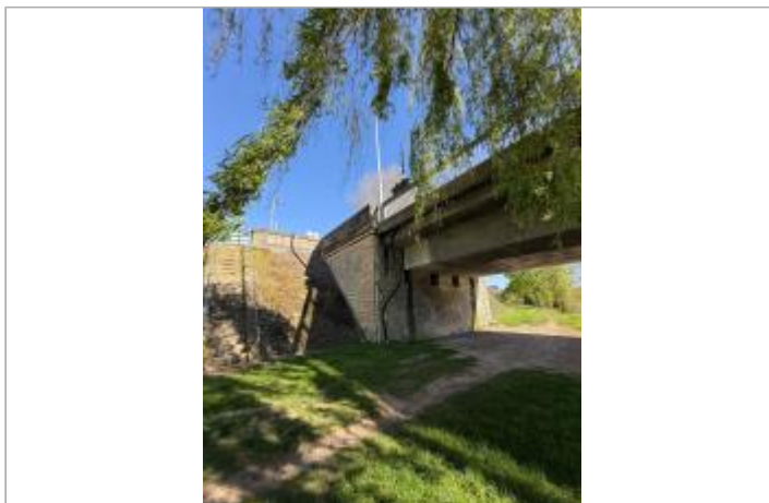
Repère de crues sous le pont côté Persan