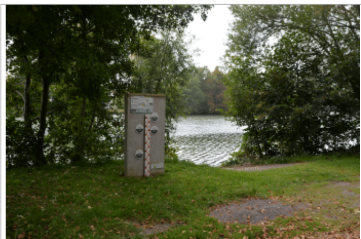
Vue des repères