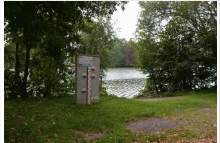
Repère de l'Entente Oise avec les principales crues en cote NGF