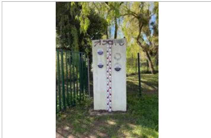
Vue des repères