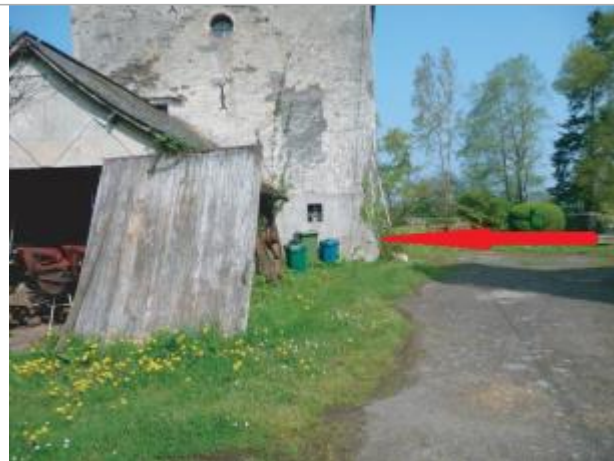
angle du bâtiment du moulin de Beaujouet