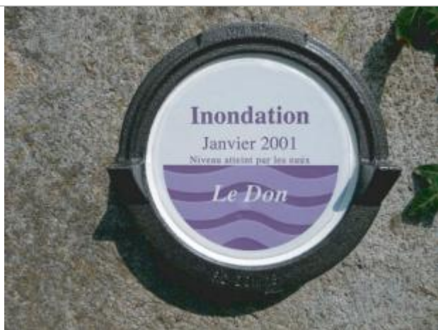
Repère de crue normalisé de janvier 2001

Altitude calculée de l'eau (en m) : 16.77