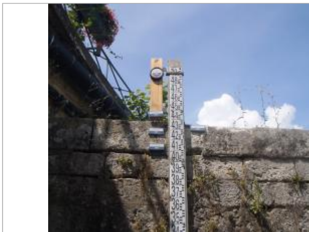
Vue du site en 2014

Coordonnées RGF93 (ETRS89) : X: 1.559197 / Y: 47.27707