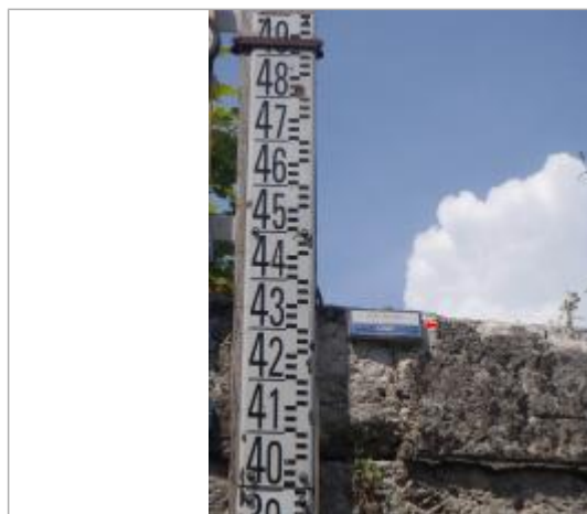
Vue du repère en 2014