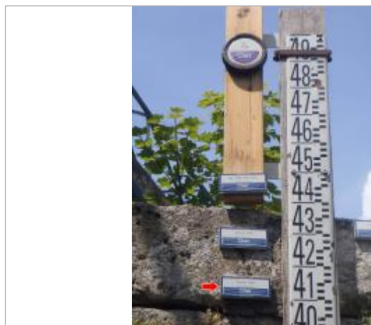
Vue du repère en 2014