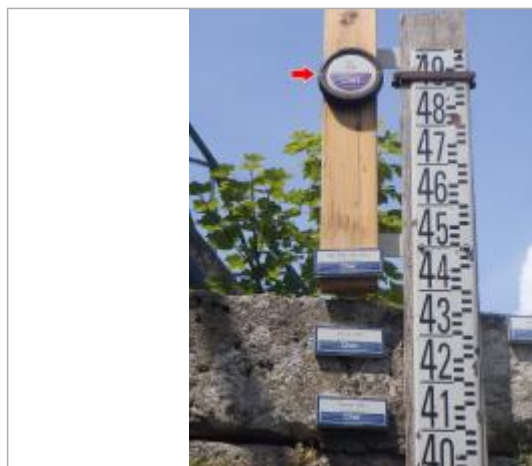
Vue du repère en 2014