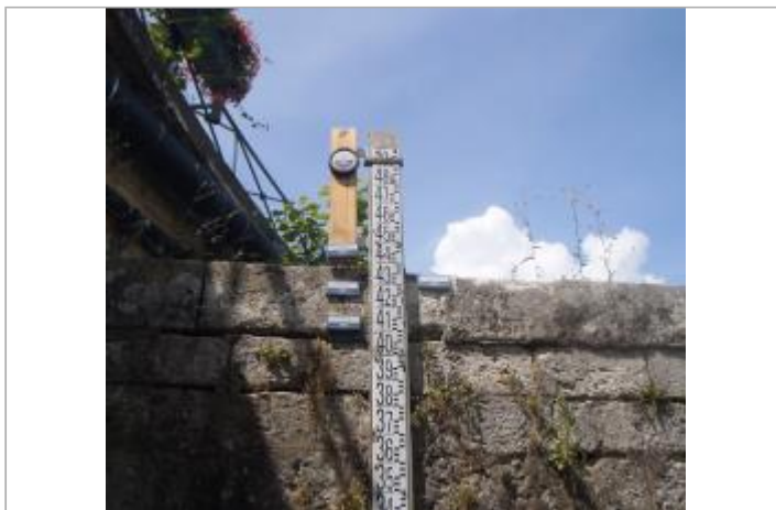
Vue du site en 2014