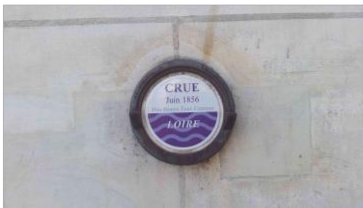
Vue du repère en 2021