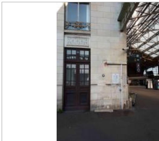
Vue du site en 2019