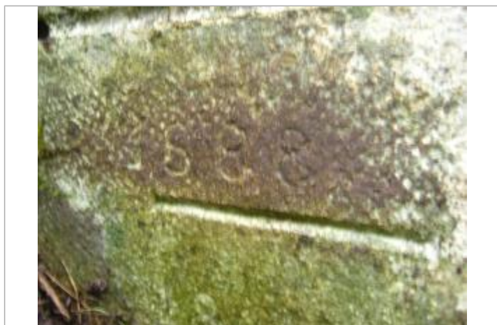
Photo du repère en 2014

Texte : 1888 Maximum de l'inondation : Non renseigné Visibilité : Non État du repère : Mauvais Pérennité : Moyenne