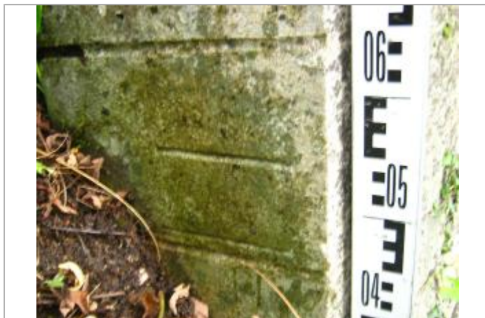
Photo des repères en 2014