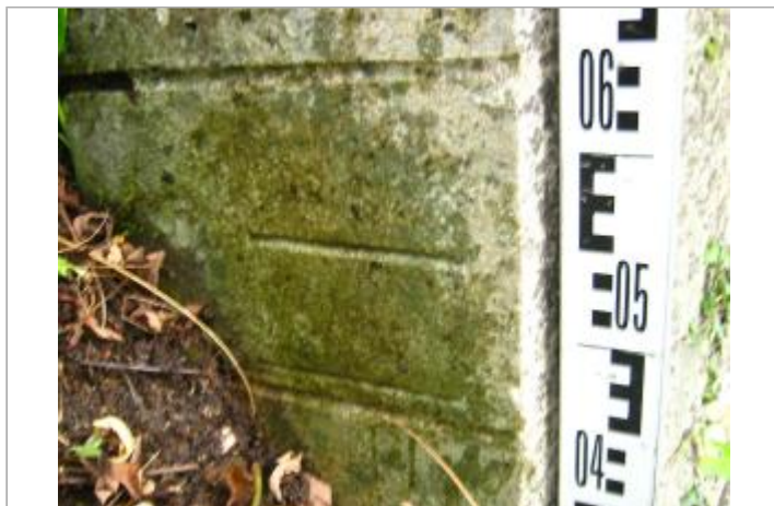
Photo des repères en 2014