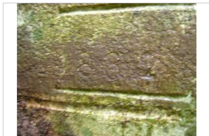
Photo du repère en 2014