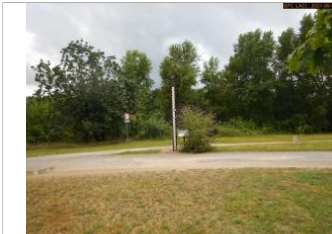
Vue du site en 2021