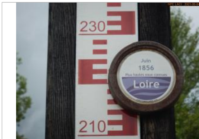
Vue du repère rapprochée en 2021