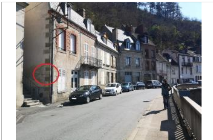
A l'angle du mur du bâtiment au niveau de l'escalier