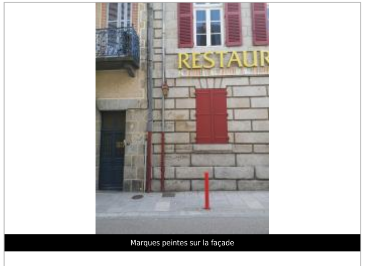
Marques peintes sur la façade

GÉOLOCALISATION Coordonnées WGS84 : X: 2.16742720 / Y: 45.95596100 Coordonnées RGF93 (Lambert 93) X: 635514.37 / Y: 6539923.28 Coordonnées RGF93 (ETRS89) : X: 2.1674272 / Y: 45.955961 Code Hydro: Rive de référence: Droite