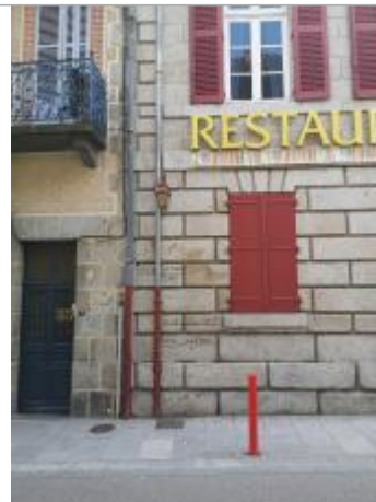
Marques peintes sur la façade