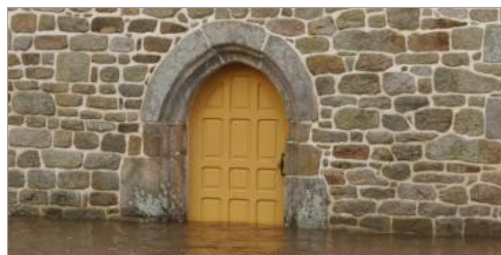
24. Décembre 2013