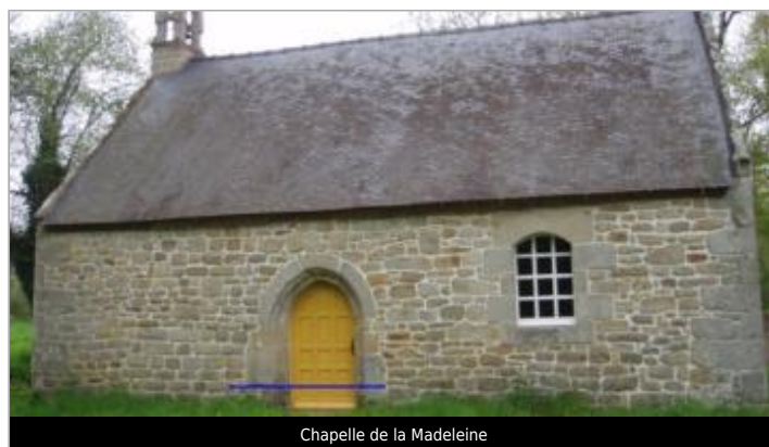
Chapelle de la Madeleine