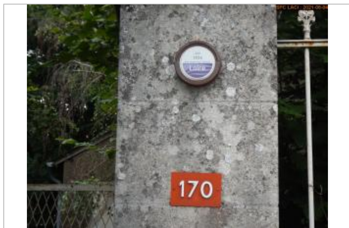
Vue du repère en 2021

Altitude calculée de l'eau (en m) : 51.107 m