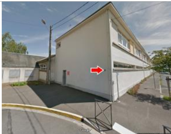
Vue du site en 2017, avec le repère de 1856