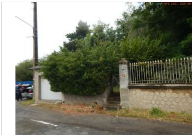
Vue du site en 2021