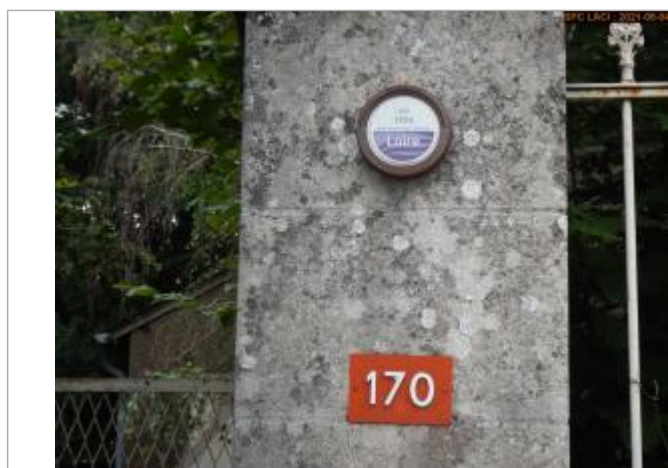
Vue du repère en 2021