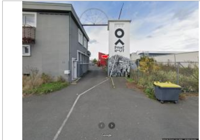
Vue du site en 2020

Coordonnées WGS84 : X: 0.72417500 / Y: 47.39707000