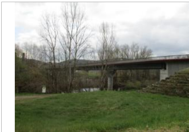
vue aval depuis la rive gauche