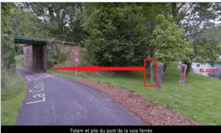
Totem et pile du pont de la voie ferrée

GÉOLOCALISATION Coordonnées WGS84 : X: -3.04290850 / Y: 47.98120300 Coordonnées RGF93 (Lambert 93) X: 249602.46 / Y: 6781777.56 Coordonnées RGF93 (ETRS89) : X: -3.0429085 / Y: 47.981203 Code Hydro: J5--0210 Rive de référence: Droite