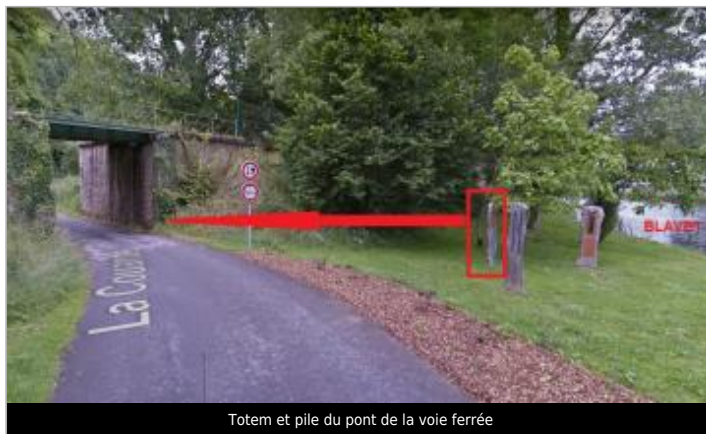
Totem et pile du pont de la voie ferrée

GÉOLOCALISATION Coordonnées WGS84 : X: -3.04290850 / Y: 47.98120300 Coordonnées RGF93 (Lambert 93) X: 249602.46 / Y: 6781777.56 Coordonnées RGF93 (ETRS89) : X: -3.0429085 / Y: 47.981203 Code Hydro: J5--0210 Rive de référence: Droite