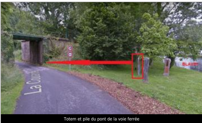
Totem et pile du pont de la voie ferrée

GÉOLOCALISATION Coordonnées WGS84 : X: -3.04290850 / Y: 47.98120300 Coordonnées RGF93 (Lambert 93) X: 249602.46 / Y: 6781777.56 Coordonnées RGF93 (ETRS89) : X: -3.0429085 / Y: 47.981203 Code Hydro: J5--0210 Rive de référence: Droite