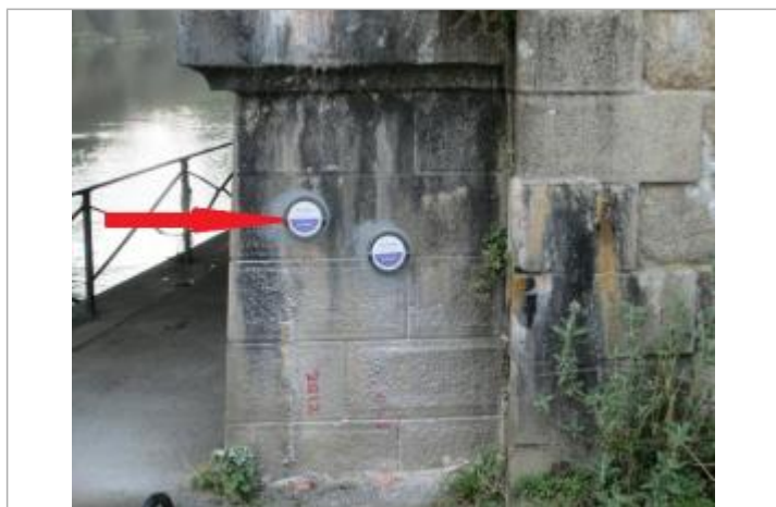
Repère normalisé de l'inondation du 23 janvier 1995