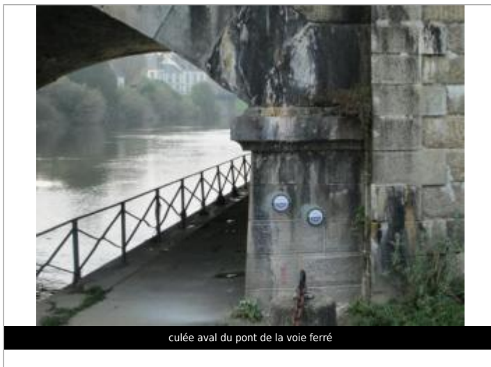
culée aval du pont de la voie ferré