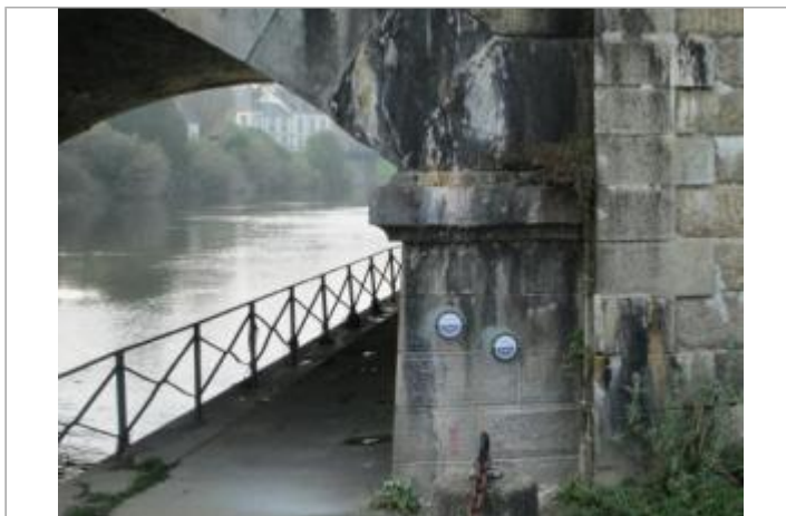
culée aval du pont de la voie ferré