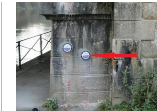
Repère normalisé de l'inondation du 15 février 1974

Texte : Inondation Février 1974 Le Blavet