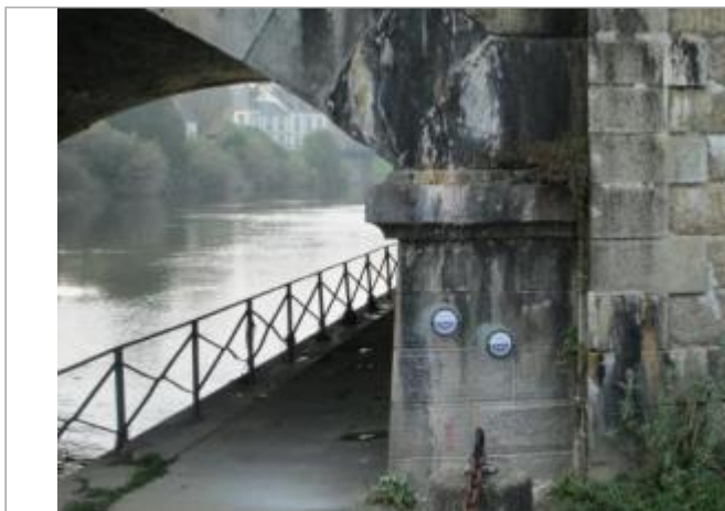
culée aval du pont de la voie ferrée

Coordonnées WGS84 : X: -2.96677930 / Y: 48.05846000