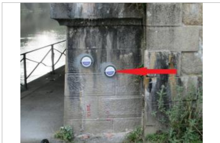
Repère normalisé de l'inondation du 15 février 1974