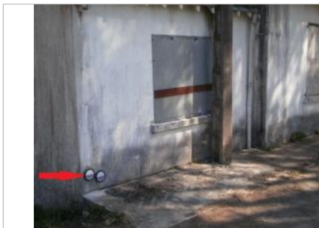
Repère normalisé de l'inondation du 23 janvier 1995