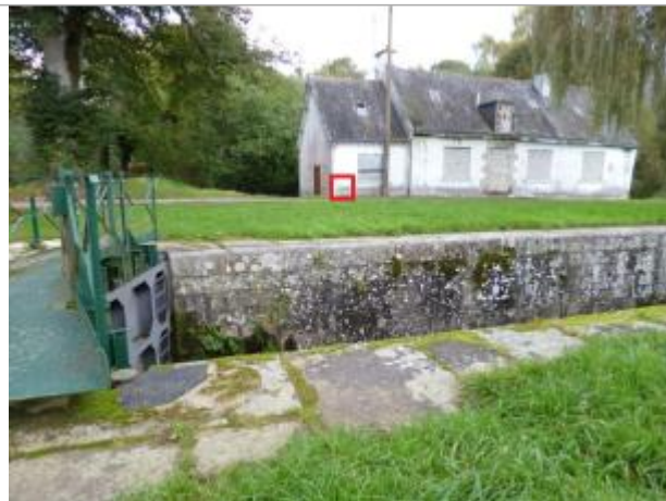
Maison éclusière n°108 Cascade

Coordonnées WGS84 : X: -2.97991180 / Y: 48.07552370