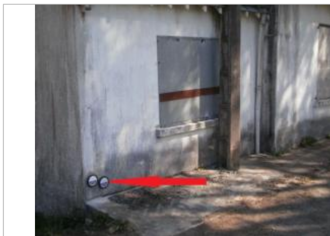
Repère normalisé de l'inondation du 23 août 1880