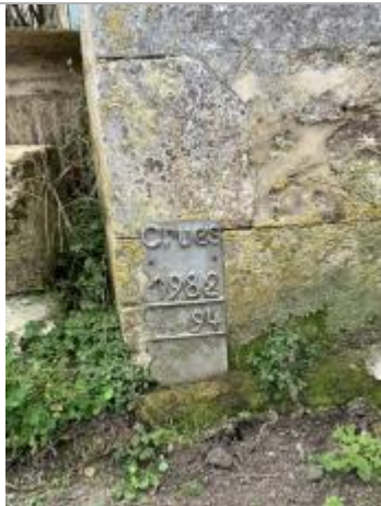
Repère de crues