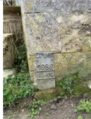
Plaque au village de la Lançonnière