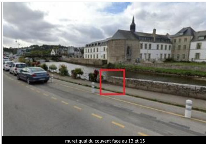
muret quai du couvent face au 13 et 15

Coordonnées WGS84 : X: -2.96646690 / Y: 48.06987400