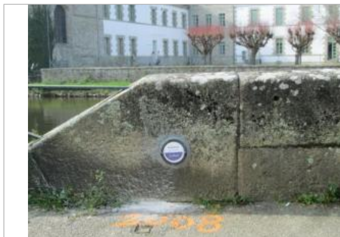
Repère normalisé de l'inondation du 23 janvier 1995

Texte : Inondation Janvier 1995 Le Blavet