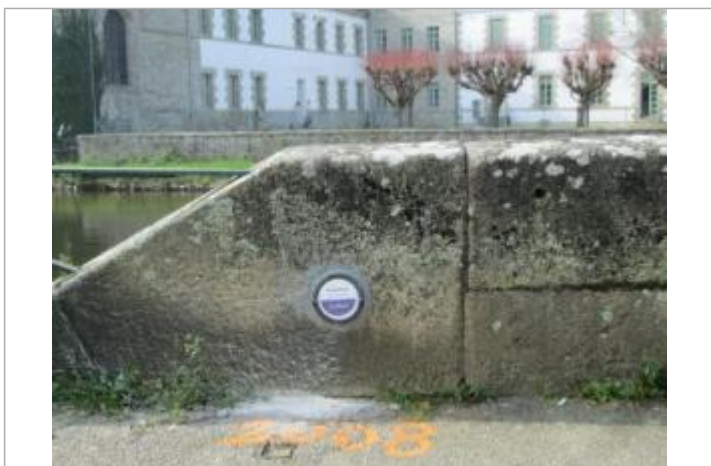
Repère normalisé de l'inondation du 23 janvier 1995

Code : BLA_PONT_9_1995 Date de mise à jour : 19/03/2021 Auteur : SPC VCB