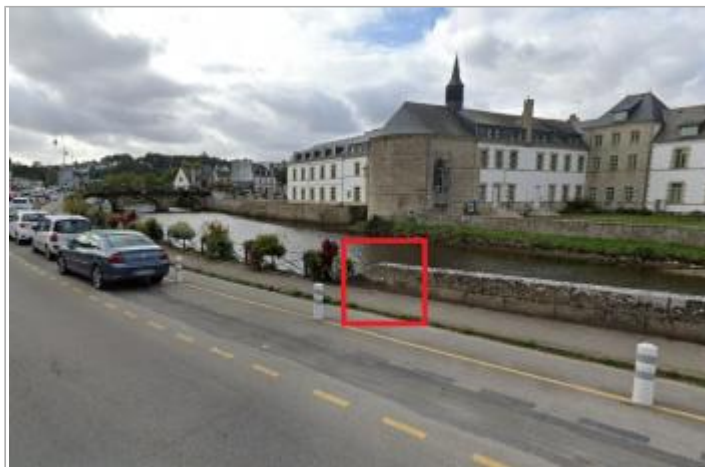
muret quai du couvent face au 13 et 15