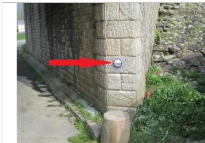
Repère normalisé de l'inondation du 5 janvier 2001