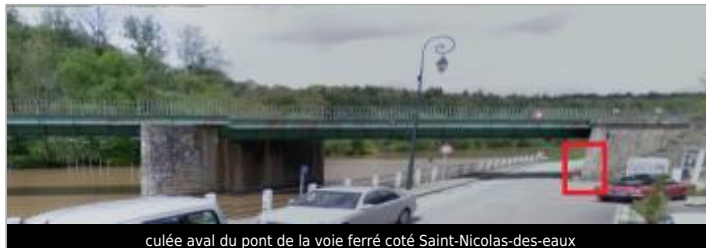
culée aval du pont de la voie ferrée coté Saint-Nicolas-des-eaux