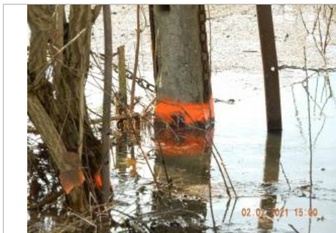
marque de peinture sur poteau en ciment

Maximum de l'inondation : Oui Visibilité : Oui État du repère : Bon Pérennité : Moyenne