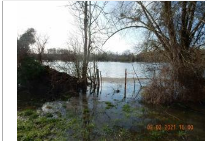
Chemin du près poteau en ciment