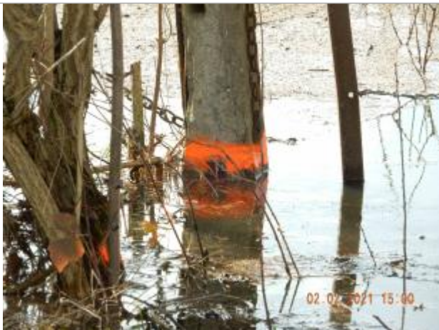
marque de peinture sur poteau en ciment

NIVELLEMENT SPC SACN. LE SPC N'EST PAS GÉOMÈTRE EXPERT, LES COTES SONT DONNÉES À TITRES INDICATIF. - 17/02/2021