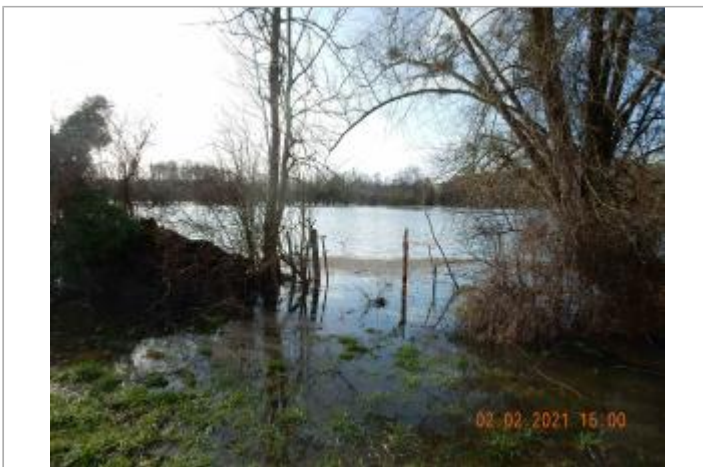
Chemin du près poteau en ciment

GÉOLOCALISATION Coordonnées WGS84 : X: 1.66118200 / Y: 49.13253700 Coordonnées RGF93 (Lambert 93) X: 602290.89 / Y: 6893355.4 Coordonnées RGF93 (ETRS89) : X: 1.661182 / Y: 49.132537 Code Hydro: H31-0400 Rive de référence: Gauche