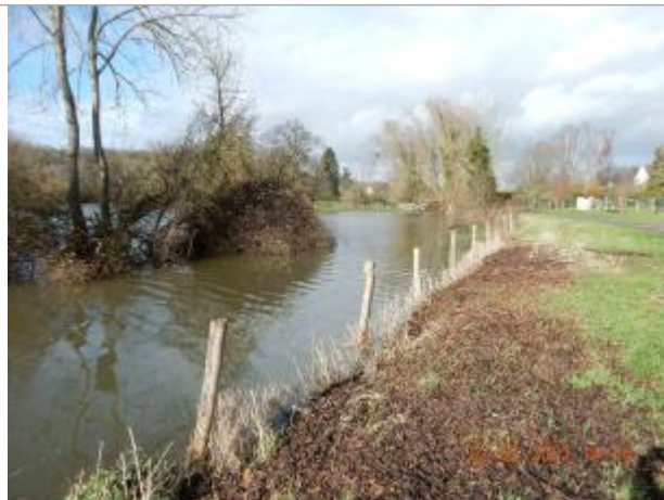
poteau de la cloture route des près