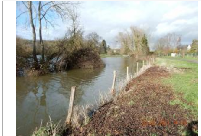
poteau de la cloture route des près