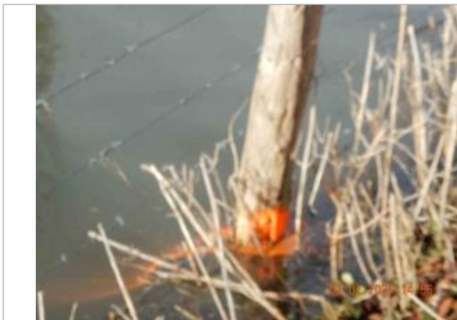
marque de peinture sur le poteau de la cloture

NIVELLEMENT SPC SACN. LE SPC N'EST PAS GÉOMÈTRE EXPERT, LES COTES SONT DONNÉES À TITRES INDICATIF. - 17/02/2021